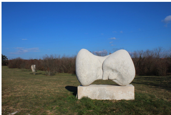
Josip Diminić, Dva tijela, 1971.

MKS-a u 2020. godini. Paralelno su pokrenute inicijative za provedbu drugih kulturno-umjetničkih i popratnih programa i sadržaja iz čega izdajamo suradnju sa Umjetničkom školom Matko Brajša Rašan iz Labina, Sportskom zajednicom Grada Labina te Udrugom SRK Alba, zatim turističkim zajednicama s područja Labinštine, kulturnim udrugama te ostalim organizacijama civilnog društva sa kojima smo prijavili zajedničke projekte. Procjenjena vrijednost prijavljenih projekata tijekom 2018. prelazi iznos od 2 milijuna kuna, a ukupno je prijavljeno 40 projekata/programa Udruge na donatore lokalnih, županijskih, nacionalnih i EU sredstava, te je dio donacija tražen osim iz javnih izvora, iz poslovnog sektora.